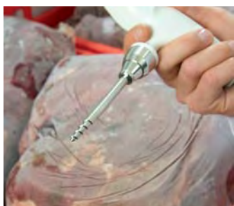
Speciální sonda do zmrazených potravin