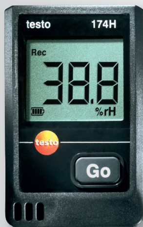
Obrázok: Originálna veľkosť